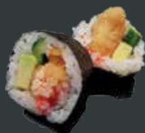
33. Crispy laks/indbagt, laks, agurk, avocado, flyvefiske- rogn, wasabi mayo, jordnødder 74 kr./132 kr.