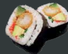
32. Ebi tempura/tempura ebi, agurk, avocado, flyvofiskerogn, chilimayo, mix salat 77 kr./137 kr.