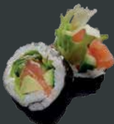
30. Sake laks/laks, agurk, avocado, flødeost, mix salat 60 kr./100 kr.