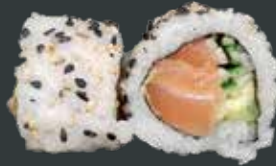
35. Laks roll/laks, agurk, avocado, sesam 74 kr.