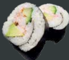
28. Ebi Hot/rejer, avocado, agurk, chilimayo 58 kr./98 kr.