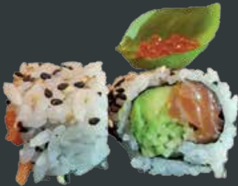
37. San Francisico/laks, basilikum, agurk, avocado, laksrogn 87 kr.