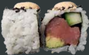
40. Spicy tun/tun, agurk, avocado, chilimayo 79 kr.