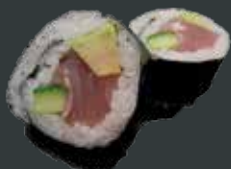
27. Tun Big/tun, avocado, agurk 58 kr./98 kr.