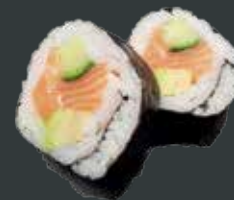
26. Laks Big/laks, avocado, agurk 58 kr./98 kr.