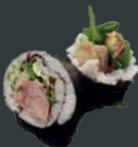
31. And roll/Grillet and, agurk, avocado, mix salat, teriyaki sauce 66 kr./117 kr.