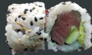
39. Tun roll/tun, agurk, avocado 75 kr.