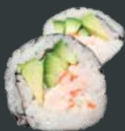
24. California Big/surimi, avocado, agurk 58 kr./98 kr.