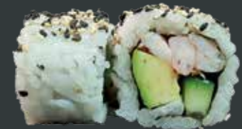
42. Spicy ebi/rejer, avocado, agurk, chilimayo 77 kr.