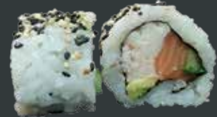
36. Super california roll/surimi, laks, agurk, avocado 74 kr.