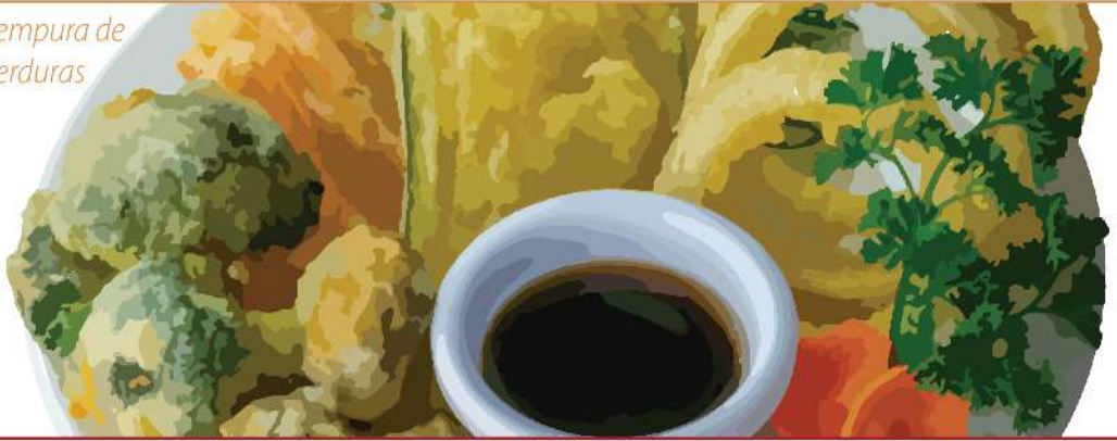
Tempura de verduras