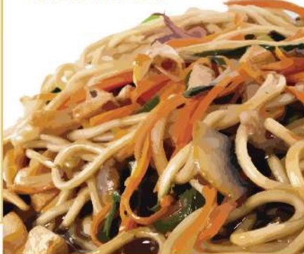
Pollo con verduras