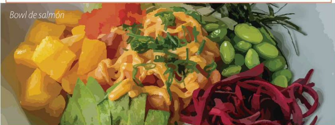
Bowl de salmón