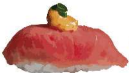
Nigiri de atún