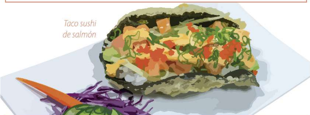
Taco sushi de salmón