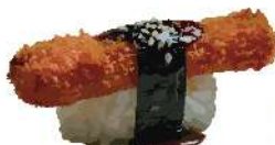
Nigiri de cangrejo