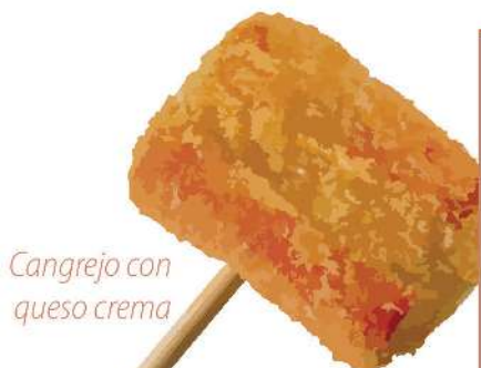
Cangrejo con queso crema