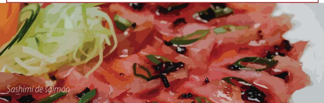
Sashimi de salmón